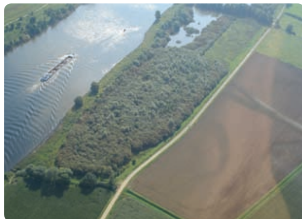
luchtfoto wilgenbos Broekhuizerweerd

Stroomlijn, beheer langs de grote rivieren