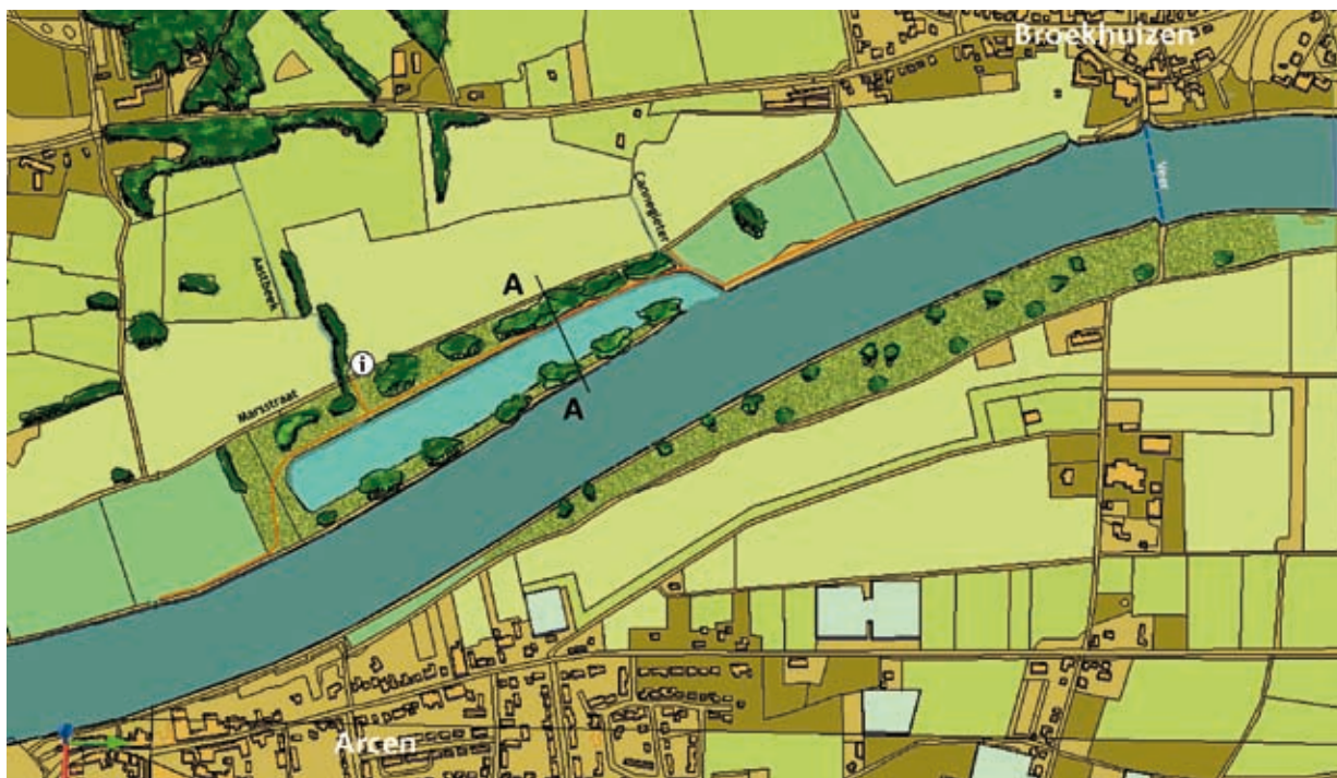
impressie nieuwe situatie